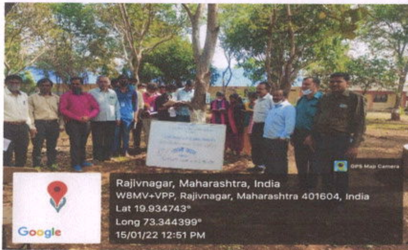
Reading section opening