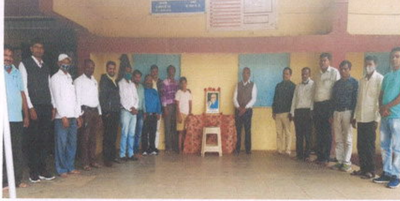
Marathi language conservation fortnight ceremony